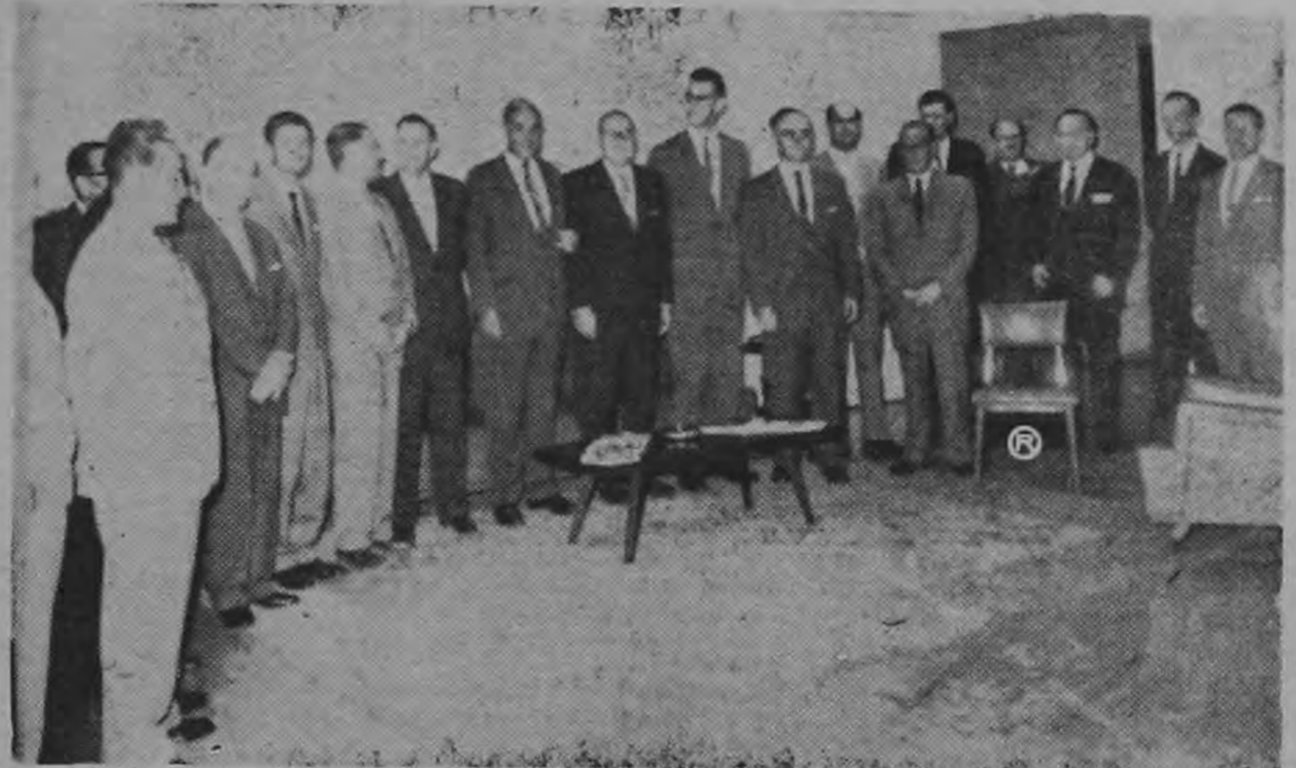
Ayer en la noche los directores y miembros de la Cámara de Comercio recibieron a la delegación norteamericana vinculada con el comercio que se encuentra de visita en el país.